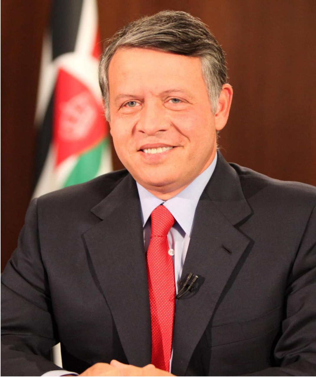
حضرة صاحب الجلالة الملك عبدالله الثاني بن الحسين المعظم