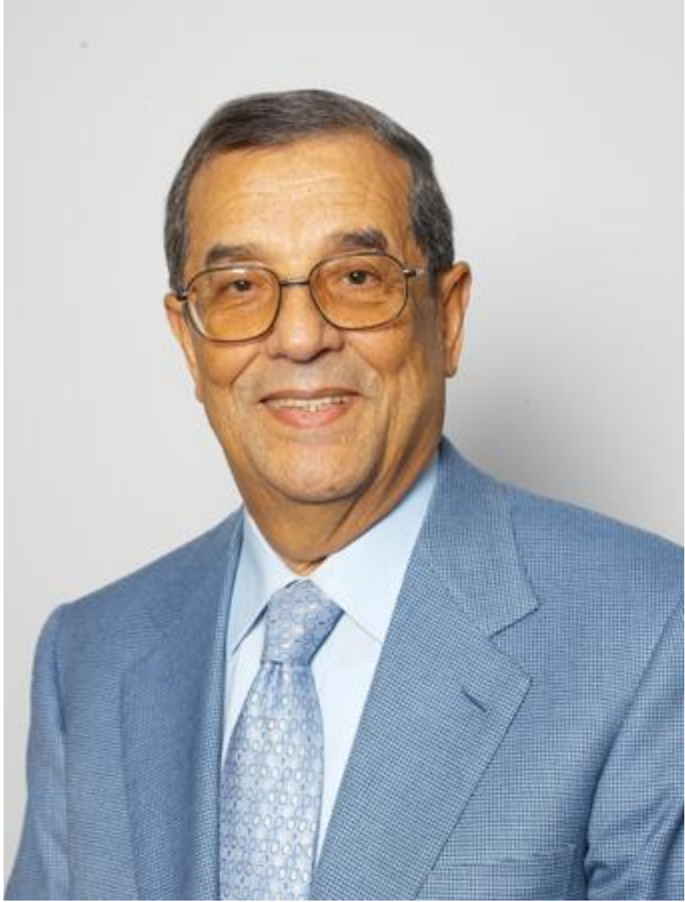
معالي المغفور له باذن الله الدكتور سميح طالب دروزه رائد الصناعة الدوائية في العالم العربي