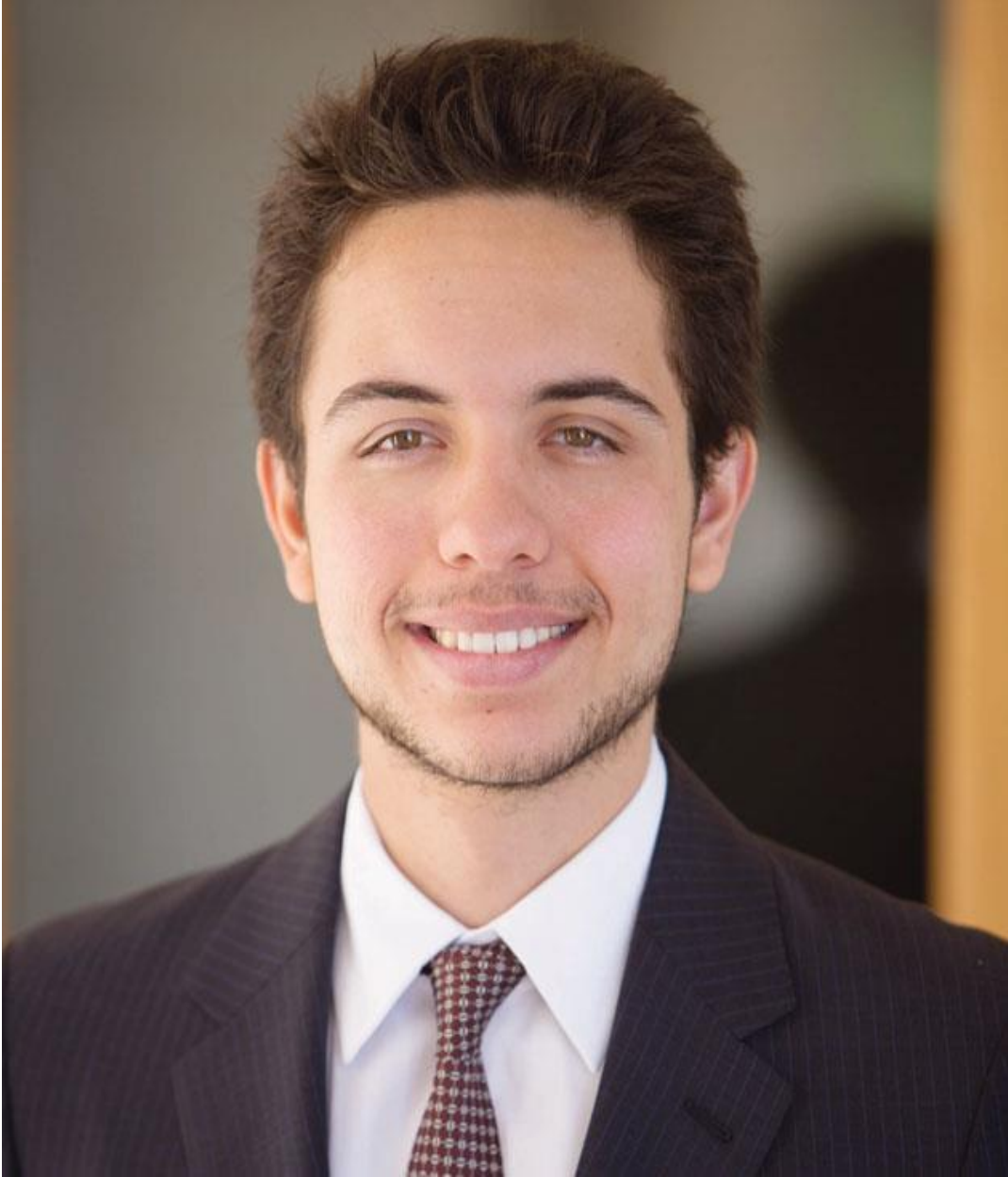
صاحب السمو الملكي الأمير الحسين بن عبدالله الثاني ولي العهد